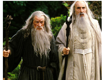
2000 LE SEIGNEUR DES ANNEAUX (The Lord of the Rings) de Peter Jackson avec Ian McKellen