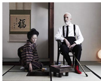
2012 LA FILLE DE NAGASAKI (The Girl of Nagasaki) d'Ayako Yoshida avec Mariko Wordell