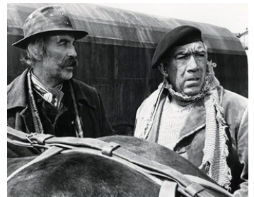
1979 PASSEUR D'HOMMES (The Passage) de Jack Lee Thompson avec Anthony Quinn