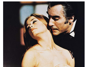
1969 UNE MESSE POUR DRACULA (Taste the Blood of Dracula) de Peter Sasdy avec Linda Hayden