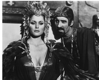
1964 LA DÉESSE DE FEU (She) de Robert Day avec Ursula Andress