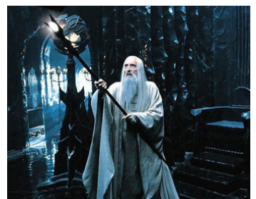
2013 LE HOBBIT, LA BATAILLE DES 5 ARMÉES (The Battle of the 5 Armies) de Peter Jackson