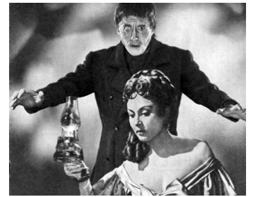
1956 FRANKENSTEIN S'EST ÉCHAPPÉ (The Curse of Frankenstein) de T. Fisher avec Hazel Court