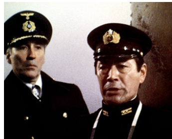
1979 1941 (1941) de Steven Spielberg avec Toshiro Mifune