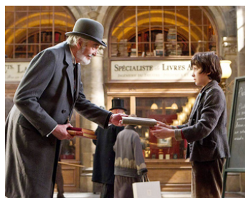
2010 HUGO CABRET (Hugo Cabret) de Martin Scorsese avec Asa Butterfield