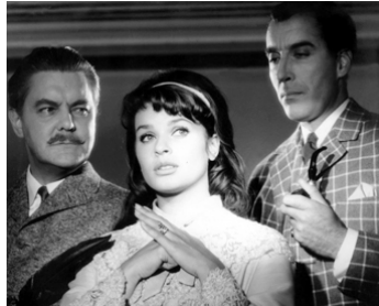
1962 LE COLLIER DE LA MORT (Valley of Fear) de T. Fisher avec Thorley Walters, Senta Berger