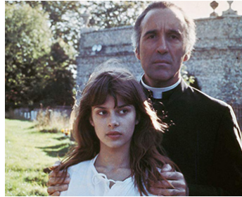
1975 UNE FILLE POUR LE DIABLE (To the Devil a Daughter) de Peter Sykes avec N. Kinsky