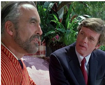
1977 CARAVANES (Caravans) de James Fargo avec Michael Sarrazin