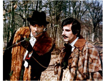
1976 DRACULA PÈRE ET FILS d'Édouard Molinaro avec Bernard Ménez