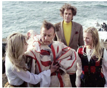
1973 LE DIEU D'OSIER (The Wicker) de Robin Hardy avec Ingrid Pitt, Edward Woodward, Britt Ekland