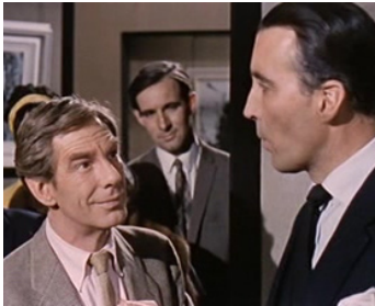
1964 LE TRAIN DES ÉPOUVANTES (Dr Terror's House of Horrors) de F. Francis avec M. Gough