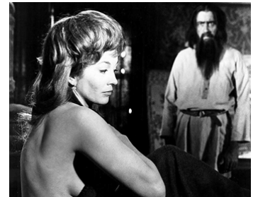
1965 RASPOUTINE, LE MOINE FOU (Rasputin) de Don Sharp avec Barbara Shelley