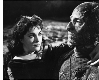
1959 LA MALÉDICTION DES PHARAONS (The Mummy) de T. Fisher avec Yvonne Furneaux