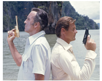
1974 L'HOMME AU PISTOLET D'OR (The Man with golden guns) de Guy Hamilton avec Roger Moore