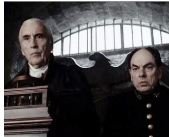
1998 SLEEPY HOLLOW (Sleepy Hollow) de Tim Burton avec Peter Guinness