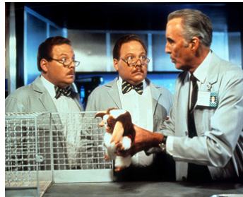
1990 GREMLINS 2 (Gremlins 2, the new batch) de Joe Dante avec Dan et Don Stanton