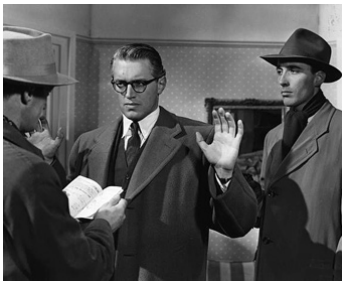
1951 LA VALLÉE DES AIGLES (Valley of Eagles) de Terence Young avec John McCallum