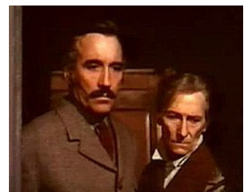
1973 TERREUR DANS LE SHANGHAI EXPRESS (Horror Express) d'E. Martin avec Peter Cushing