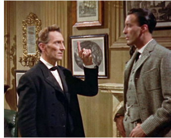
1958 LE CHIEN DES BASKERVILLE (The Hound of the Baskerville) de T. Fisher avec P. Cushing