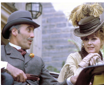
1970 LA VIE PRIVÉE DE SHERLOCK HOLMES de Billy Wilder avec Geneviève Page