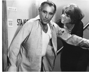
1975 LES NAUFRAGÉS DU 747 (Airport 77) de Jerry Jameson avec Lee Grant