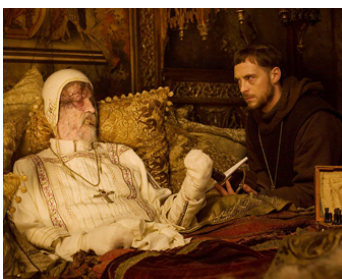
2010 LE DERNIER DES TEMPLIERS (Season of the Witch) de Dominic Sena avec Stephen C. Moore