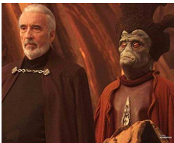
2001 STAR WARS, L'ATTAQUE DES CLONES (Attack of the Clones) de George Lucas