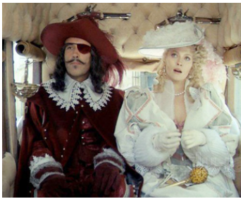
1973 LES TROIS MOUSQUETAIRES (The three Musketeers) de R. Lester avec Raquel Welch