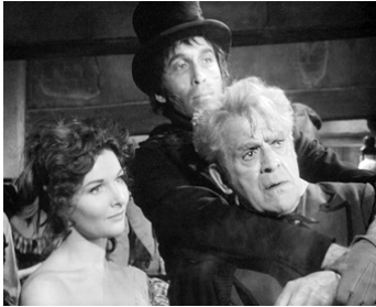
1958 CORRIDORS OF BLOOD de Robert Day avec Adrienne Corri, Boris Karloff