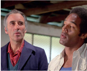
1975 LES MERCENAIRES (Killer Force) de Val Guest avec O. J. Simpson