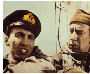
1955 COMMANDO DANS LA GIRONDE (The Cookleshell Heroes) de et avec José Ferrer