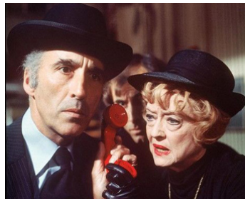
1978 LES VISITEURS D'UN AUTRE MONDE (Witch Mountain) de J. Hough avec Bette Davis