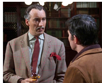
1968 LA MAISON ENSORCELÉE (The Curse of the Crimson Altar) de Vernon Sewell