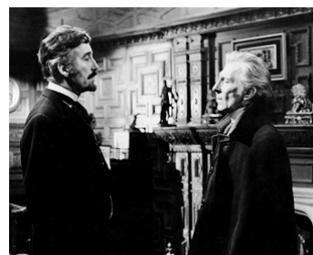
1972 LA CHAIR DU DIABLE (The creeping Flesh) de Freddie Francis avec Peter Cushing