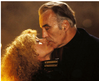
1985 HURLEMENTS 2 (Howling II) de Philippe Mora avec Sybil Danning