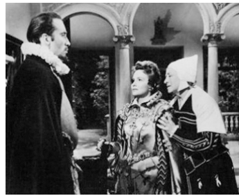
1954 LA PRINCESSE D'EBOLI (That Lady) de T. Young avec Olivia de Havilland, F. Rosay