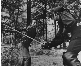
1961 L'ATTAQUE DE SAN CRISTOBAL (The Pirates of Blood River) de J. Gilling avec Kerwin Matthews