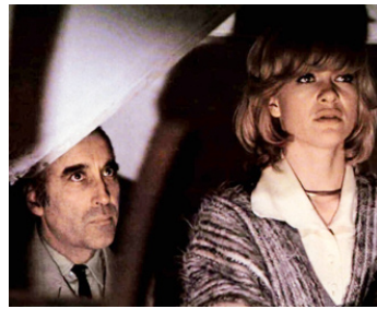
1974 DIAGNOSTIC MEURTRE (Diagnosis: Murder) de Sidney Hayers avec Judy Geeson